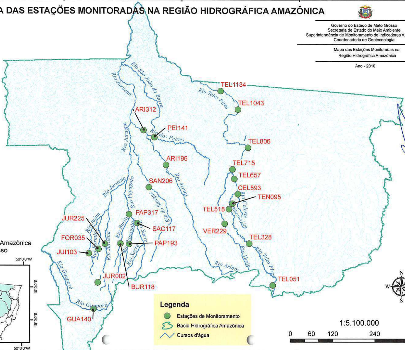
Localização da Bacia Amazônica no Mato Grosso