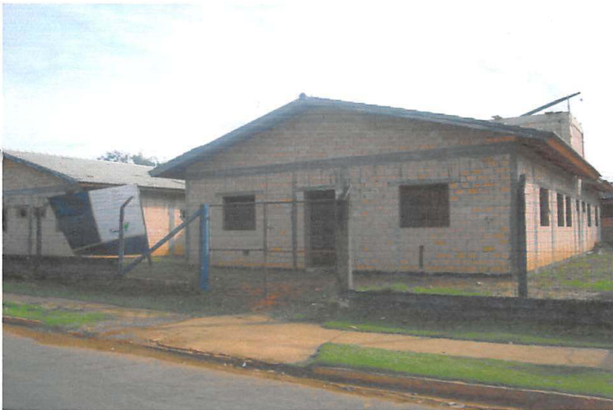
PSF – Programa Saúde da Família Bairro Bela Vista