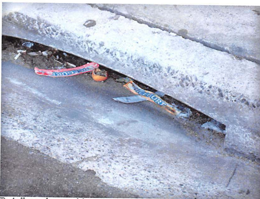
Detalhes dos residuos entrando nas bocas de lobo.