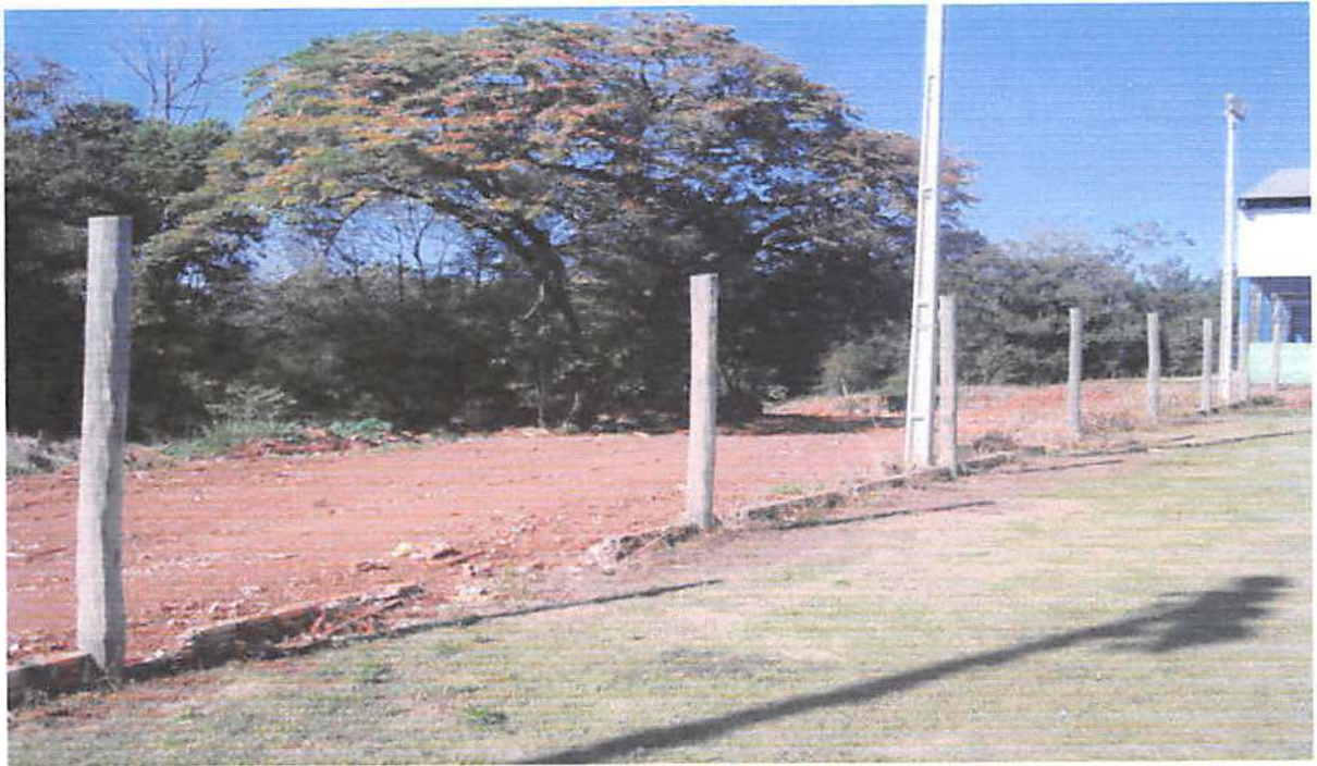
CAMPO DE FUTEBOL BAIRRO BOM JESUS, CONSTRUÇÃO DO ALAMBRADO.