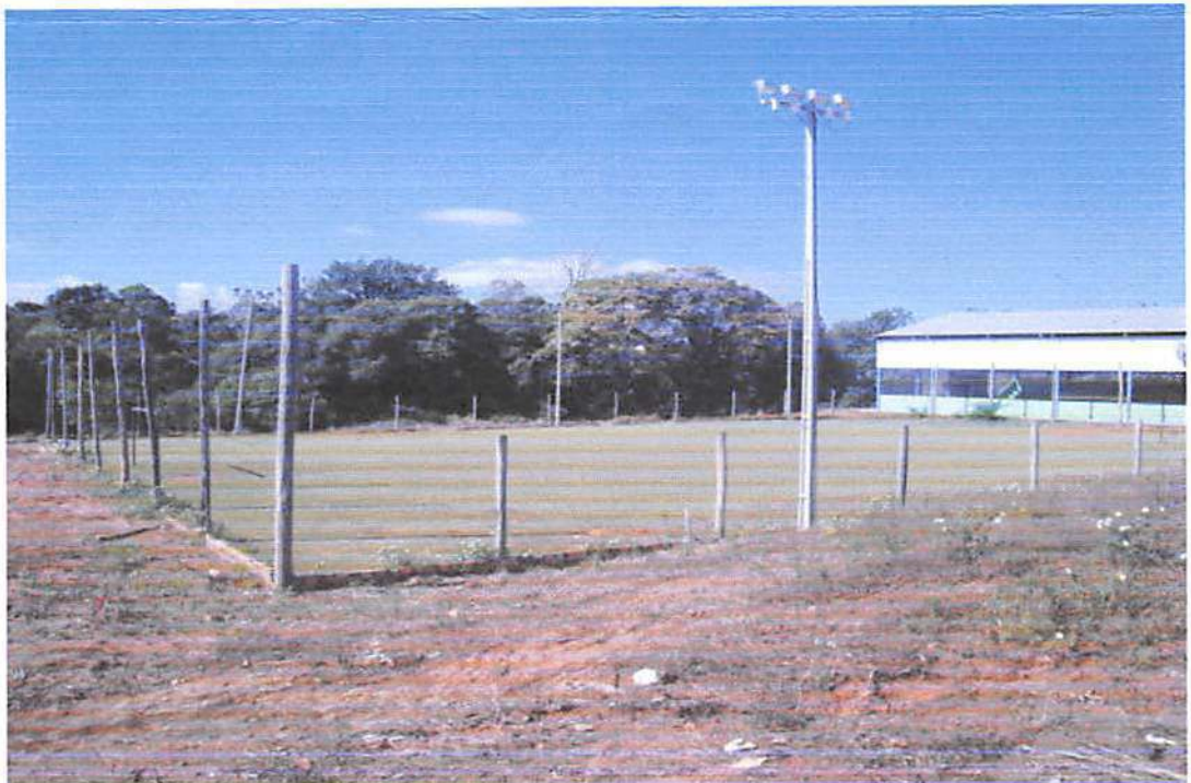
CONSTRUÇÃO DO ALAMBRADO.