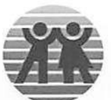
JOSÉ DOMINGOS FRAGA FILHO Prefeito Municipal